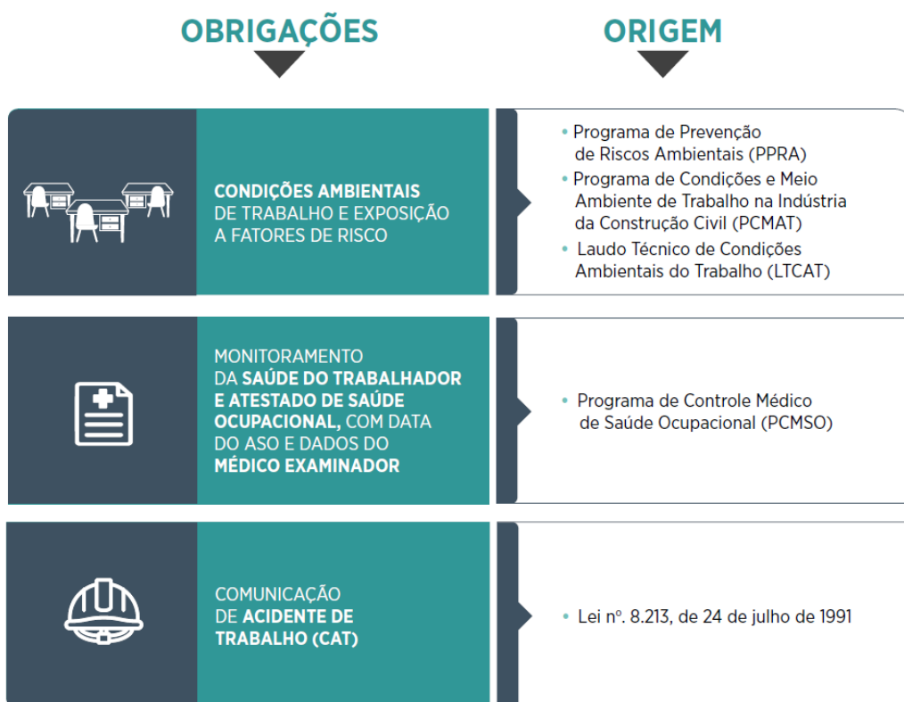
Figura 8 – A origem das obrigações de SST